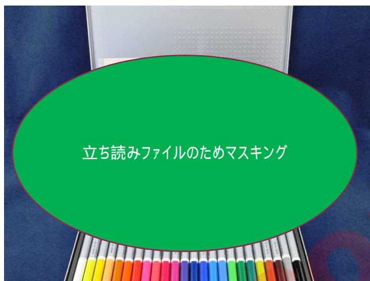
写真 2-2 ドイツ S 社製 水彩色鉛筆